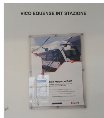
Impianto tipo bacheca in plex dimensioni cm 100*140