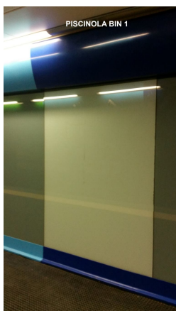
Impianto tipo bacheca in vetro dimensioni cm 150*200 – utilizzare materiale pubblicitario in PVC removibile