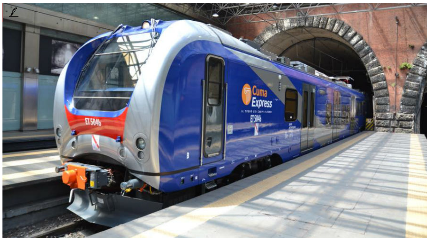
( http://mobilita.org/wp-content/uploads/2019/06/cuma-express.jpg )