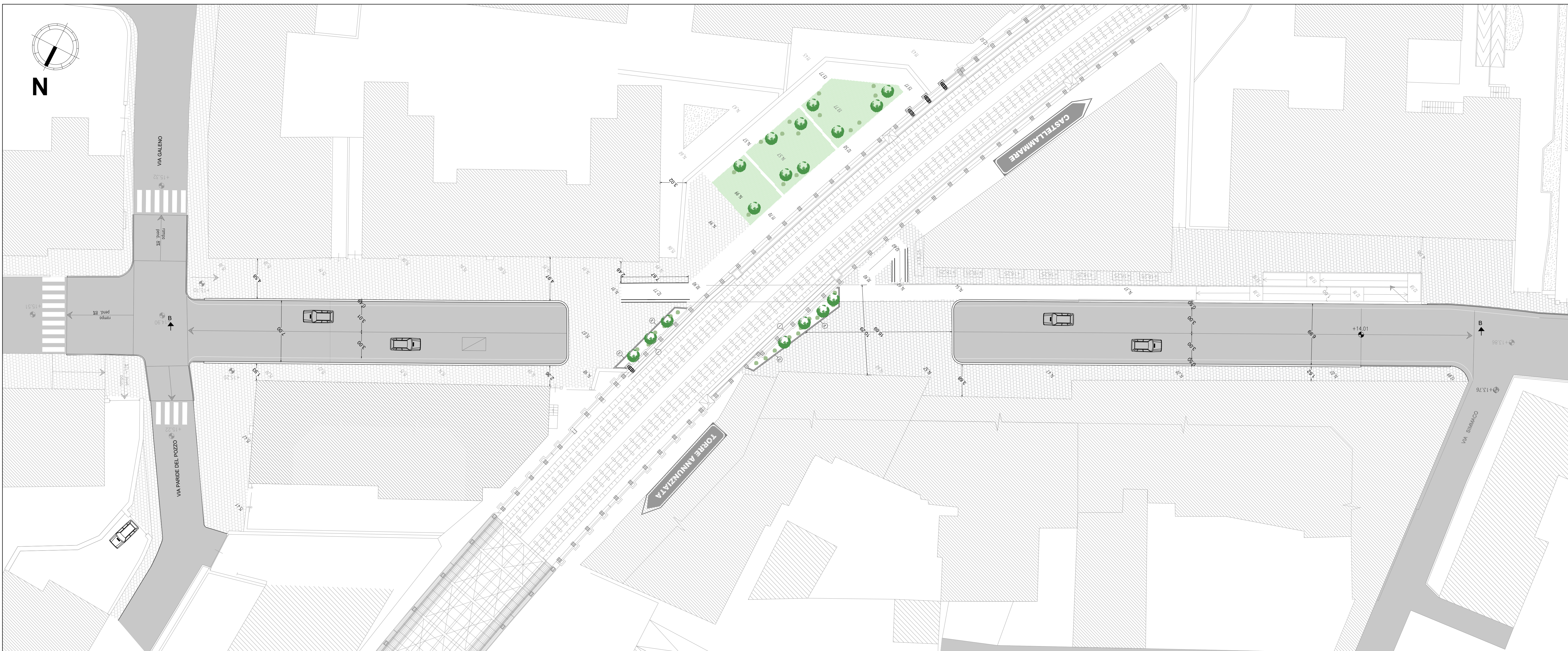
PLANIMETRIA GENERALE SOTTOPASSO Scala 1:200