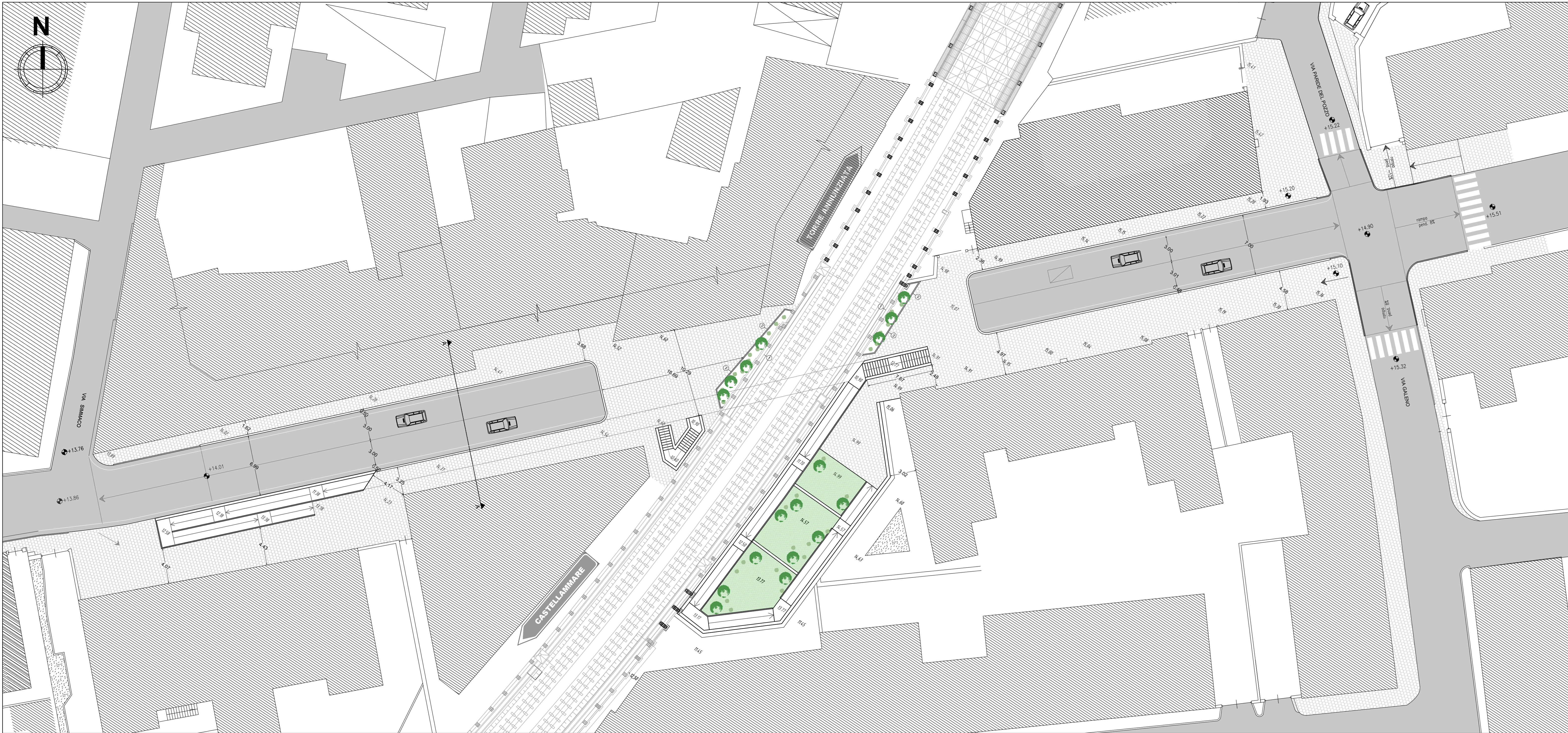
PLANIMETRIA GENERALE - Pianta quota sottopasso Scala 1:200