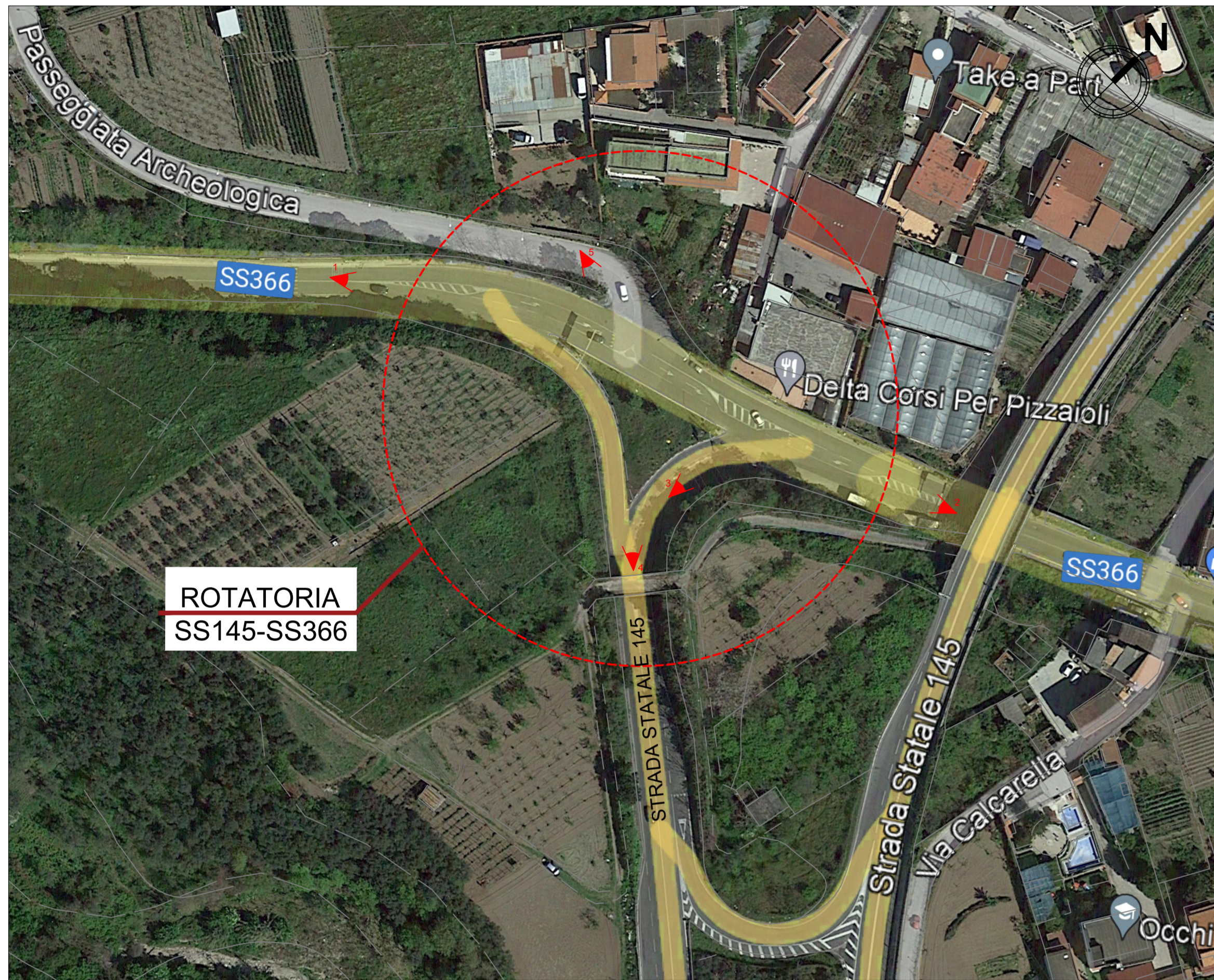
STATO DI FATTO - SCALA 1:100