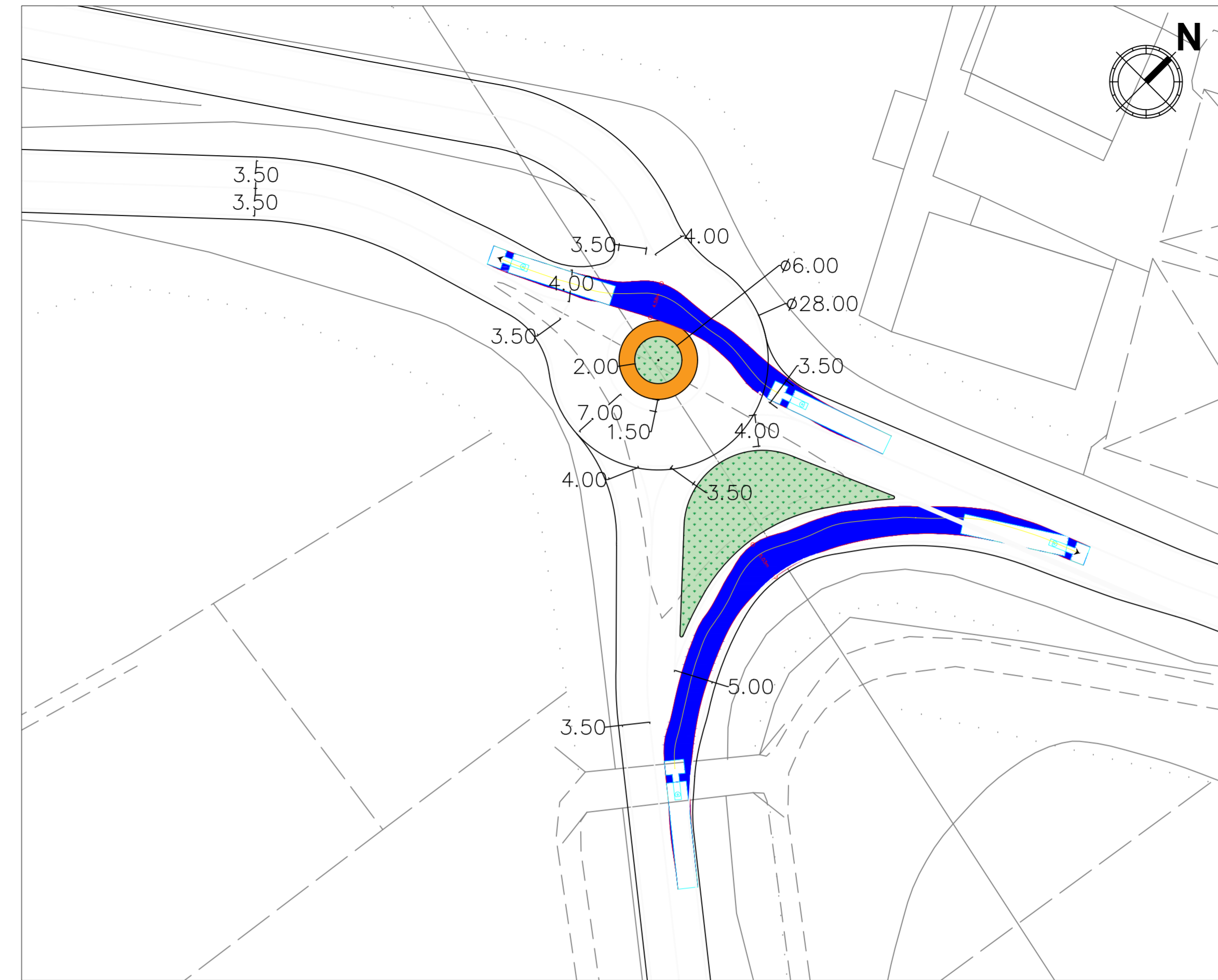
PLANIMETRIA DI PROGETTO - SCALA 1:200